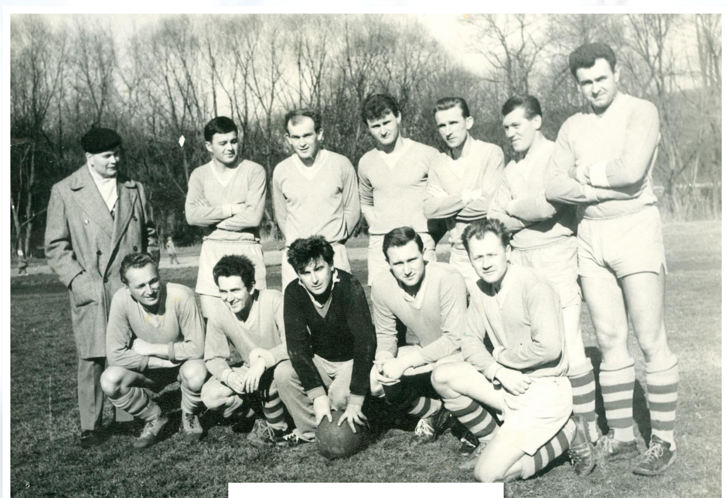
I. mužstvo (1966)