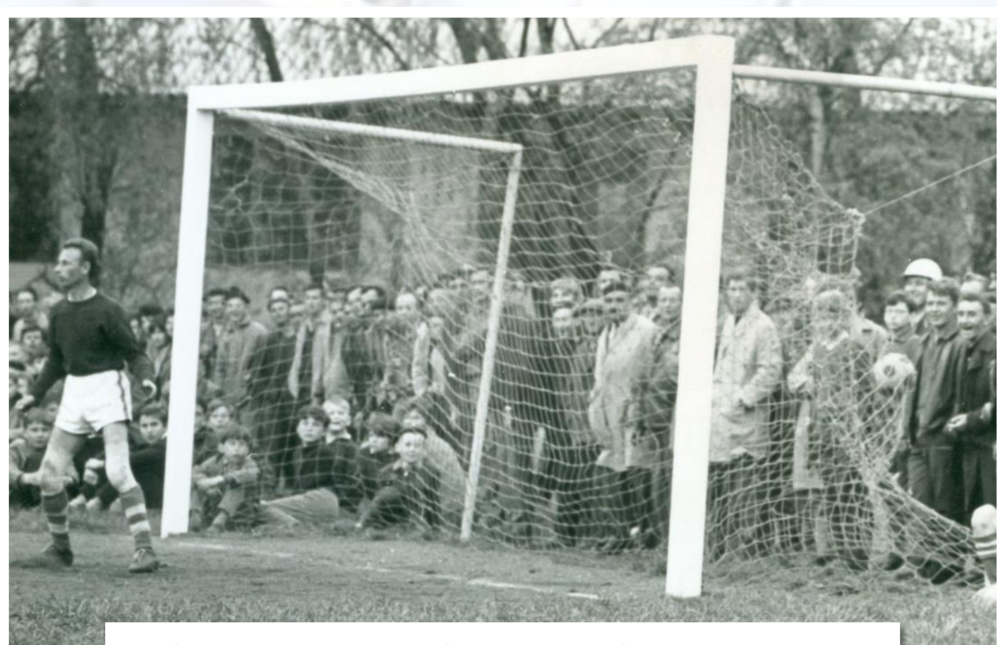
Stará garda Slavie v Sedlčanech s účastí 1 800 diváků (duben 1966)