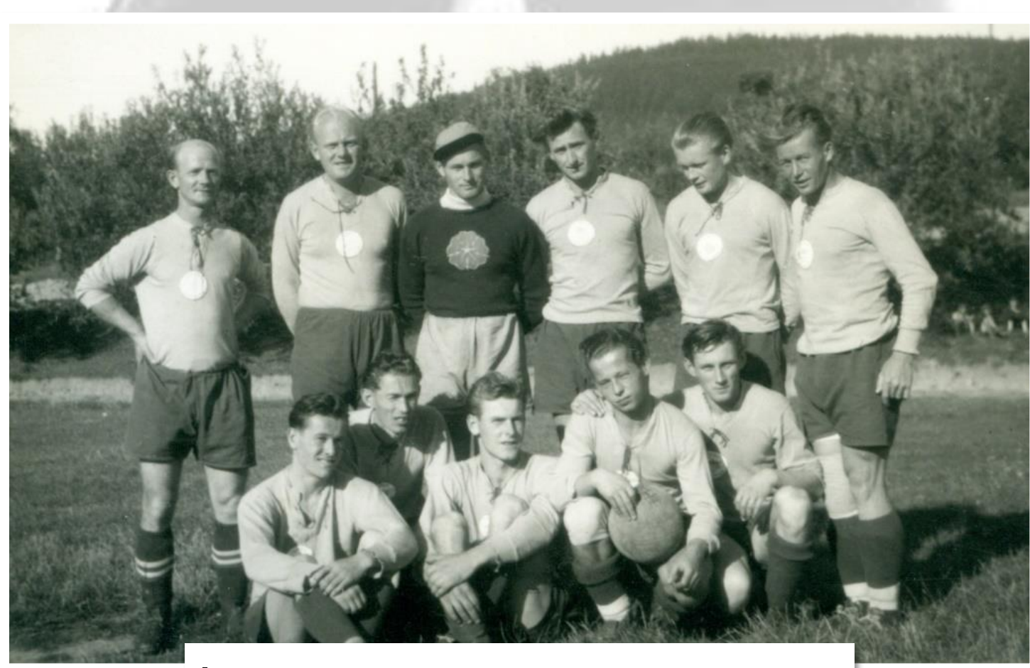
I. mužstvo po vítězném zápase ve Voticích, skóre 9:3 (1949)