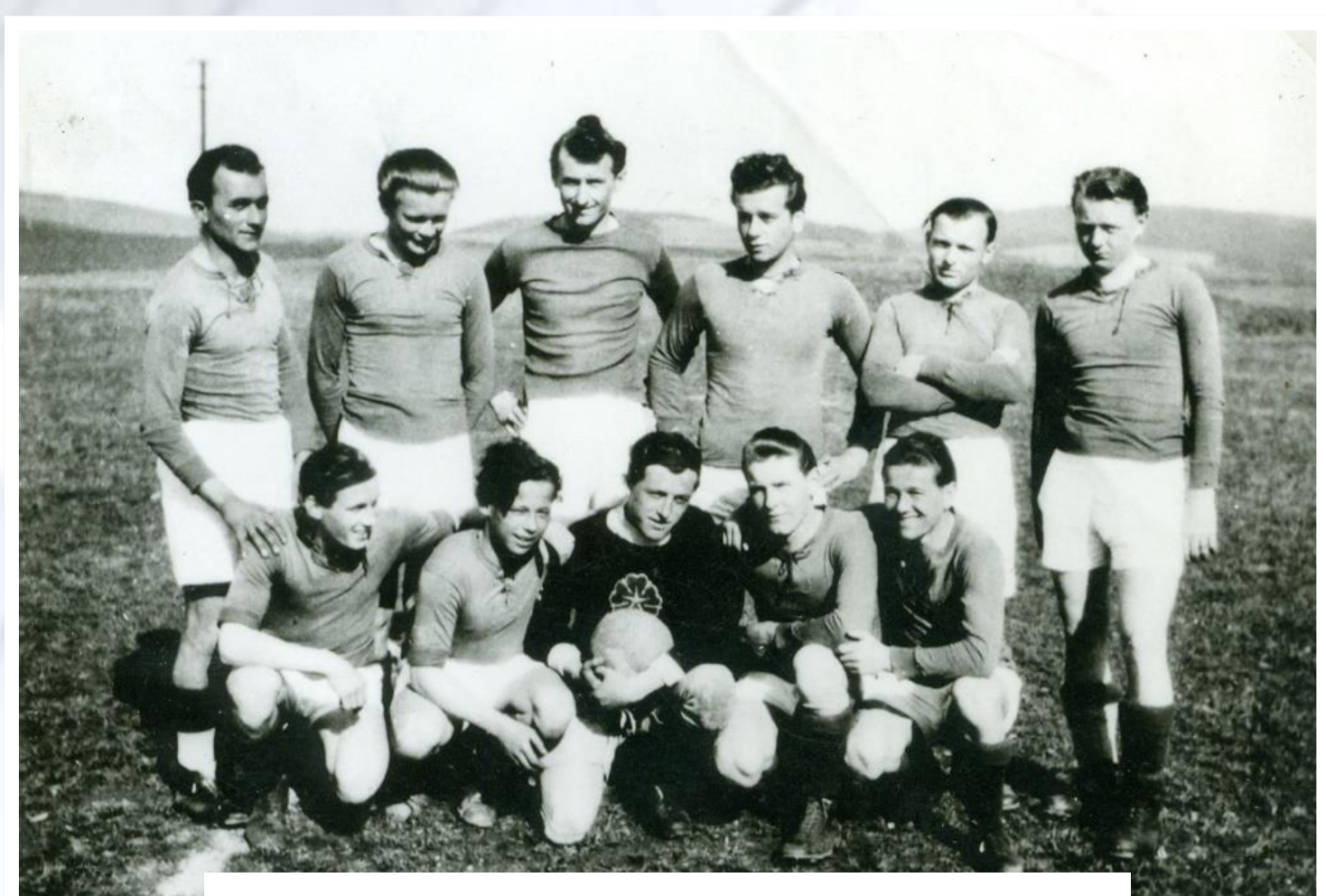
Poválečné období (1945–1946)

Postupně se stabilizovala funkcionářská základna a podařilo se zlepšit výkonnost fotbalového oddílu. V druhé polovině desetiletí hrálo mužstvo dospělých úspěšně II. třídu Středočeského kraje a v roce 1959 si vybojovalo postup do I. třídy. Rozmach fotbalu potvrdilo přihlášení druhého týmu dospělých do okresních soutěží. Dařilo se také žákovskému fotbalu, do soutěží byla přihlášena tři žákovská družstva. Významným úspěchem byl v roce 1956 zisk titulu krajského přeborníka. Další úspěchy dosáhli mladí fotbalisté po přechodu do dorostenecké kategorie, kde se probojovali do krajských soutěží.