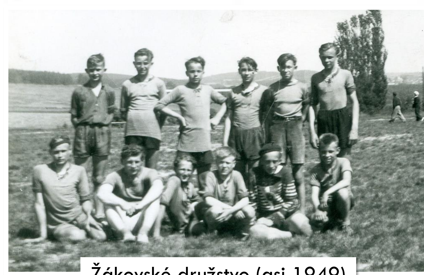
Žákovské družstvo (asi 1949)