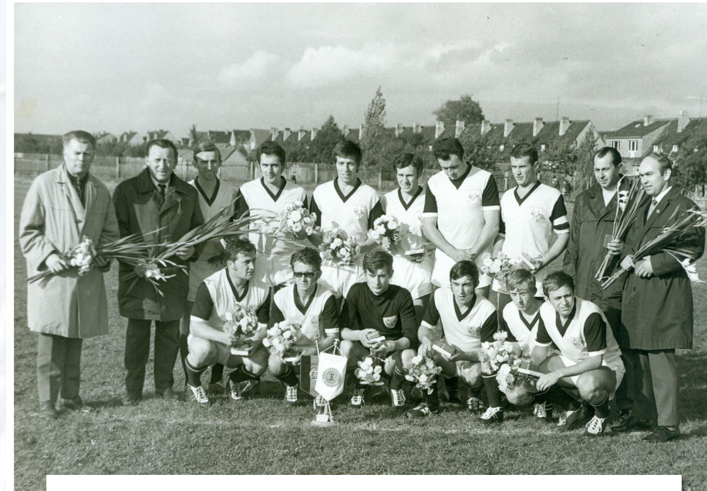
Mužstvo TATRANU na hřišti v Kölldě (NDR) – poprvé za hranicemi (říjen 1970)